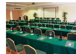
Sala de Convenciones.

Silos I y II , en el primero y Cardeña I y II en el segundo: aforo para 15 y 30 personas en todas las formas de montaje. Estos salones son ideales para pequeñas reuniones. Por último, también situado en el edificio principal, el Salón La Reserva , con capacidad para 80 personas.